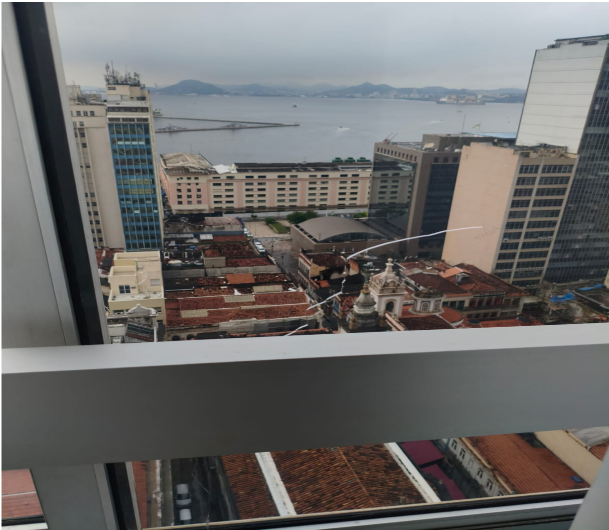
20º pavimento (janela fachada)