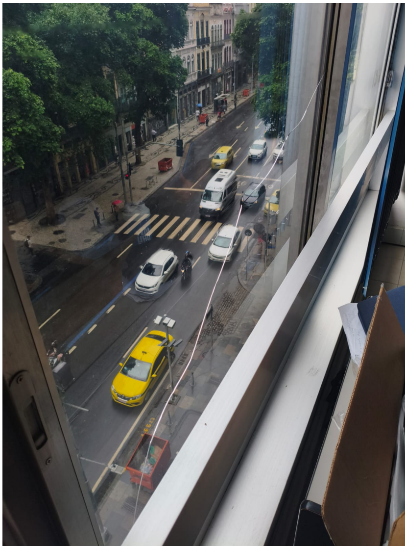
5º pavimento (janela fachada)