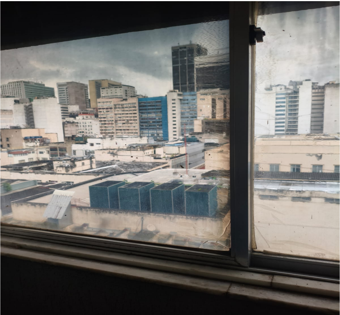
16º andar (janela fundos)